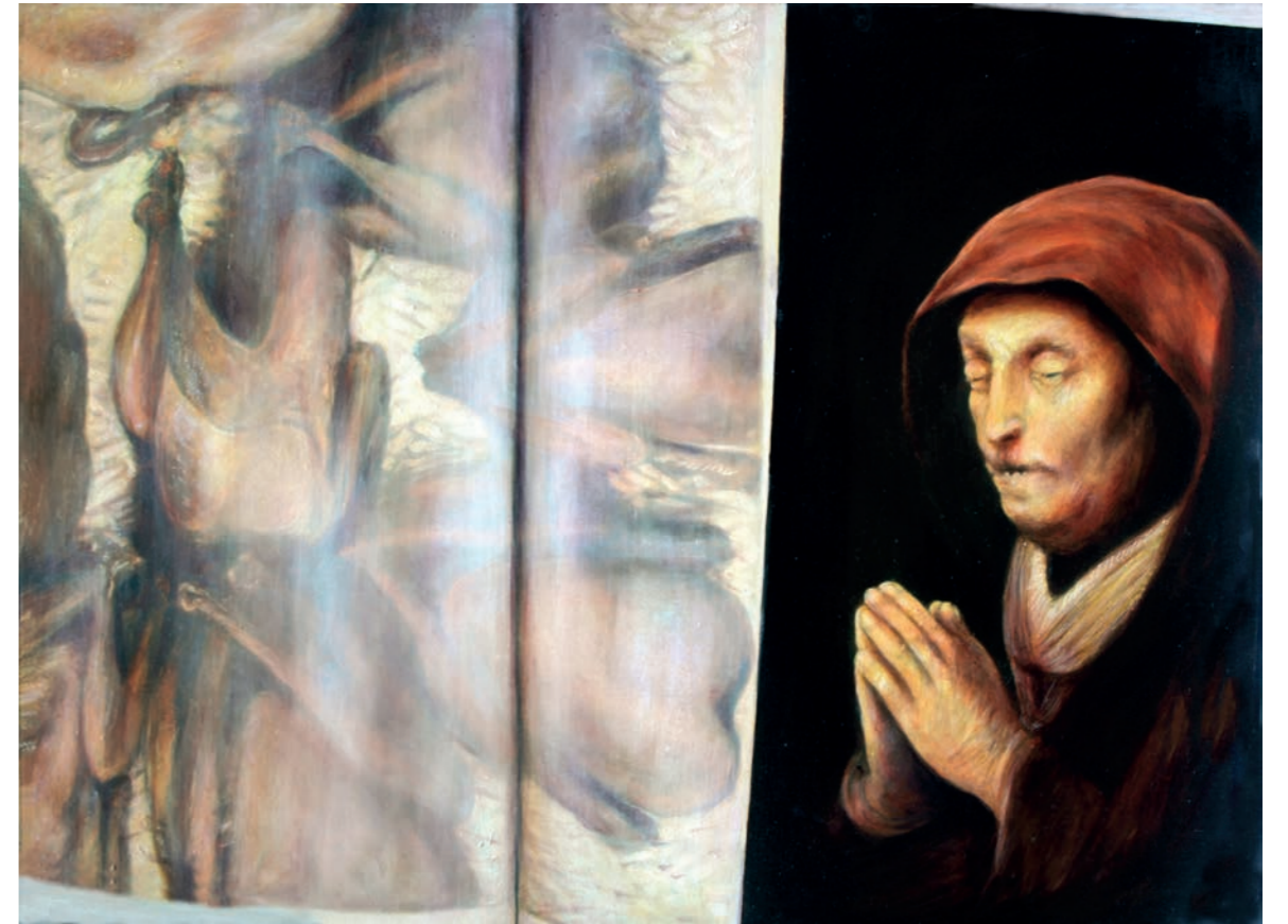
Wachteln an Rembrandt

2013 | Öl, Eitempera auf Holz | 60 x 80 cm